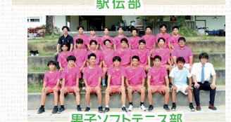
男子ソフトテニス部