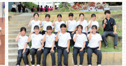
女子ソフトテニス部