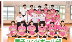
男子ハンドボール部