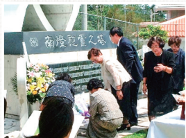
同窓会行事 (南燈慰霊之塔慰霊祭)