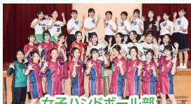
女子ハンドボール部