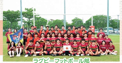
ラグビーフットボール部